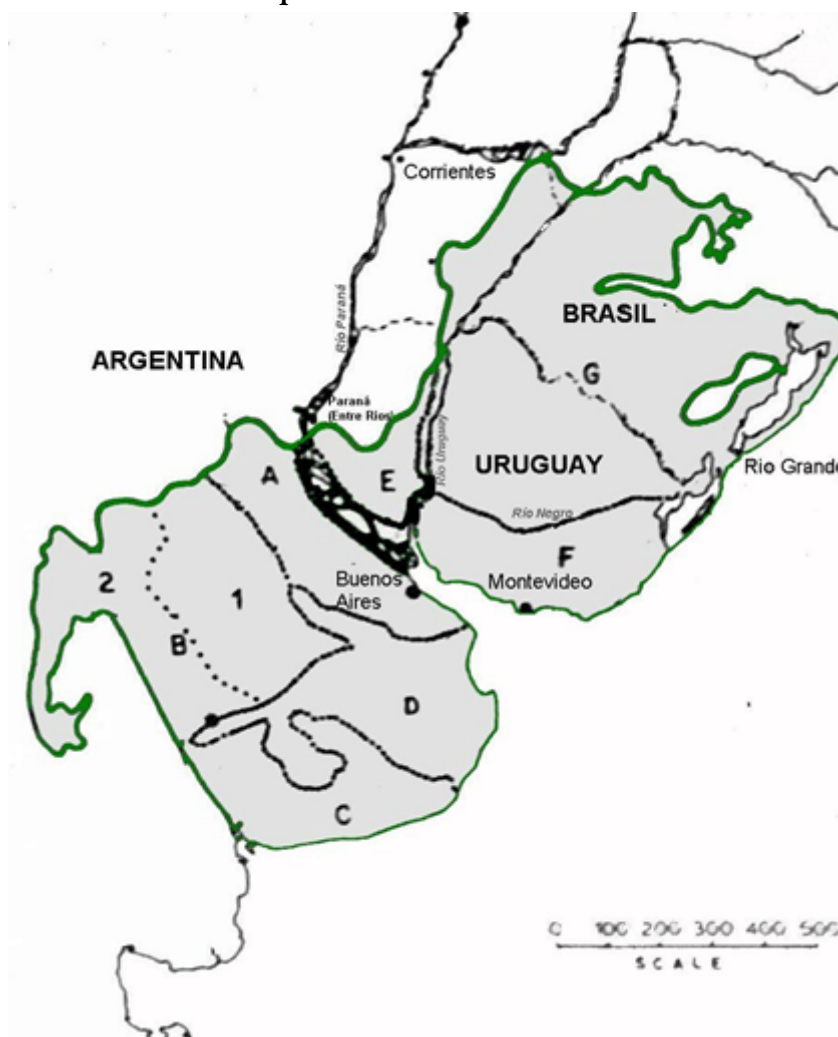
FIGURA 1 Los pastizales del Río de la Plata